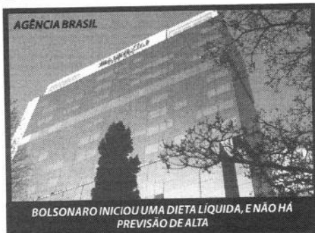
BOLSONARO INICIOU UMA DIETA LÍQUIDA, E NÃO HÁ PREVISÃO DE ALTA

O desconforto foi causado por uma suboclusão in-